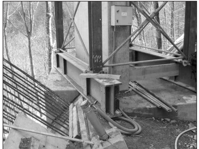
Extensometer am Bogenwiderlager