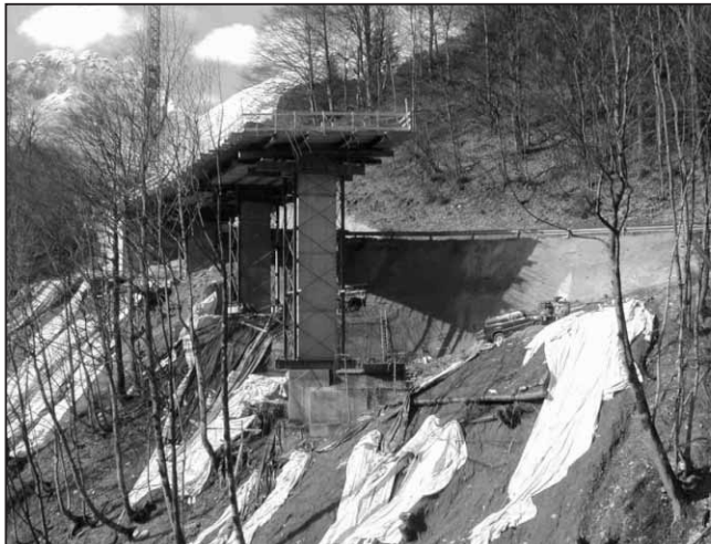
Bau der Zauchengrabenbrücke

Im Jahre 2001 wurde mit dem Bau der Zauchengrabenbrücke begonnen. Das Bauwerk befindet sich in einem geologisch sensiblen Gebiet und stellte höchste Ansprüche an die Planung. Um die Wechselwirkungen zwischen Brücke und dem Untergrund besser zu erforschen und wichtige Erkenntnisse für ähnliche Bauwerke in der Zukunft zu erhalten, sollen Sohlspannungen und Verformungen an den Fundamenten und Widerlagern messtechnisch erfasst werden.