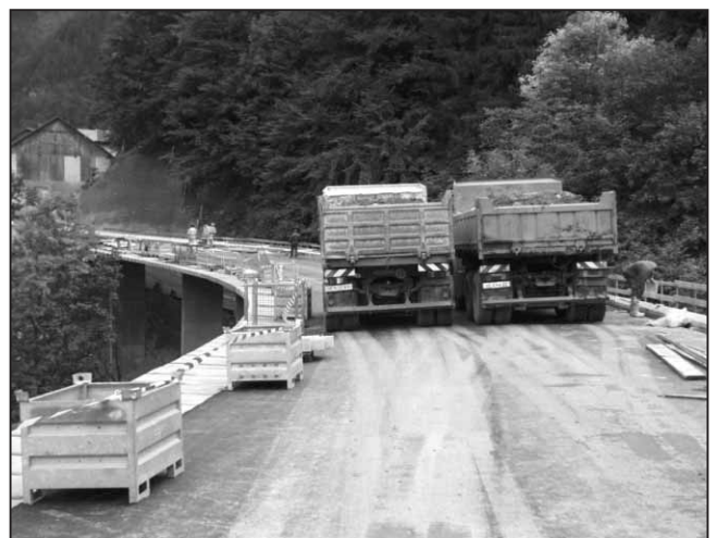
Probebelastung der fertiggestellten Brücke