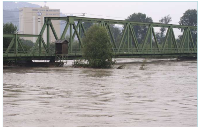
Abfluss größer als 1100 m 3 /s (Jahrhundert-Hochwasser 2005)