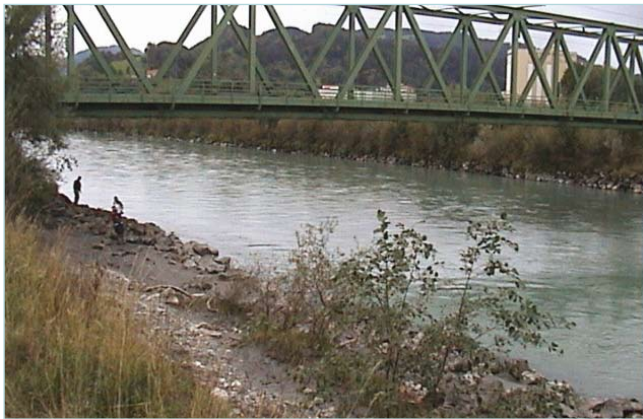
Mittlerer Abfluss bei circa 250 m 3 /s

Messtechnik um Beschädigungen sowie Ausfälle der Anlage zu verhindern. Einfache und kostengünstige Montage sowie Inbetriebnahme des Messsystems.